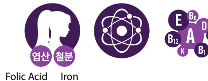
Active Daily Multi for Women