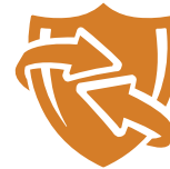
SUPER D PLUS ZINC IMMUNE COMPLEX